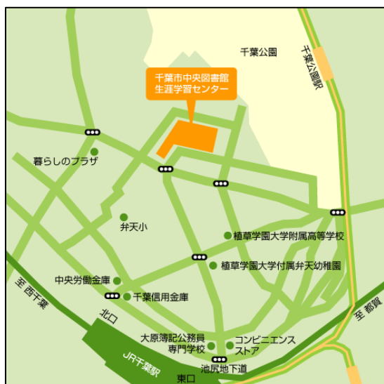
千葉市生涯学習センター地図